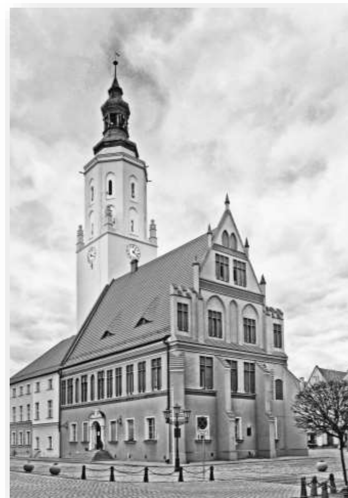
Ratusz w Namysłowie, fot. Krzysztof Norbert Wolf

Powiat Namysłowski może pochwalić się bogatą i ciekawą historią. Ukształtowany historycznymi wpływami ośrodków takich jak Wrocław, czy współczesna Wielkopolska, a w okresie powojennym także wpływem ludności z dawnych kresów II Rzeczypospolitej, ma cechy charakterystyczne dla miejsc przenikania się kultur i tradycji. Materialne pamiątki minionych wieków wpływają również na atrakcyjność turystyczną Ziemi Namysłowskiej. Odkrywców historii zainteresują na pewno zachowane dworki, założenia parkowe, a przede wszystkim obiekty sakralne czy charakterystyczne przydrożne kapliczki i krzyże pokutne.