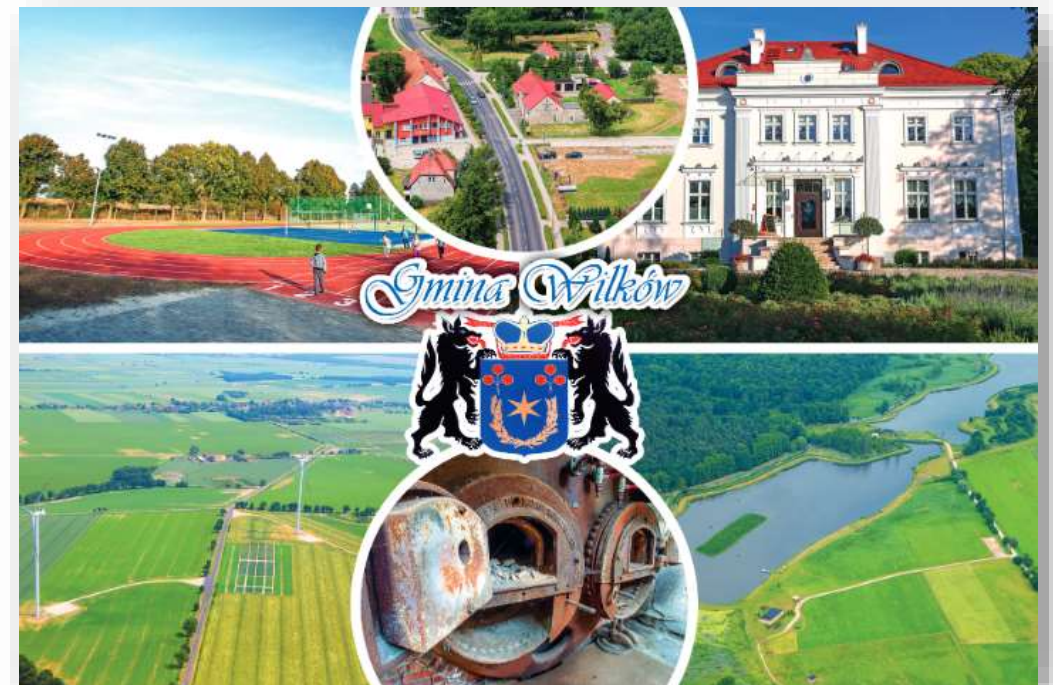
Materiał promocyjny Gminy Wilków