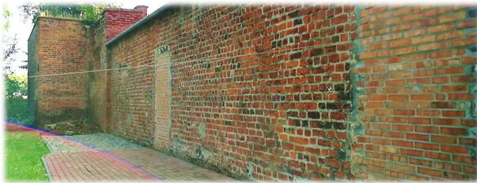
Fragment muru od strony ulicy Staszica

Pierwotnie pierścień murów miejskich był wzmocniony prawdopodobnie aż 45 basztami i wieżami. Znaczne fragmenty pierścienia systemu obronnego zachowały się do dziś. Większe ciągi zachowanych murów miejskich widoczne są w części północnej (wzdłuż rzeki Widawy), wschodniej, przy bramie Krakowskiej oraz południowej.