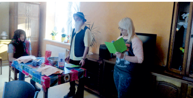
Młodzież podczas skeczu „Piekł dziadek babkę”