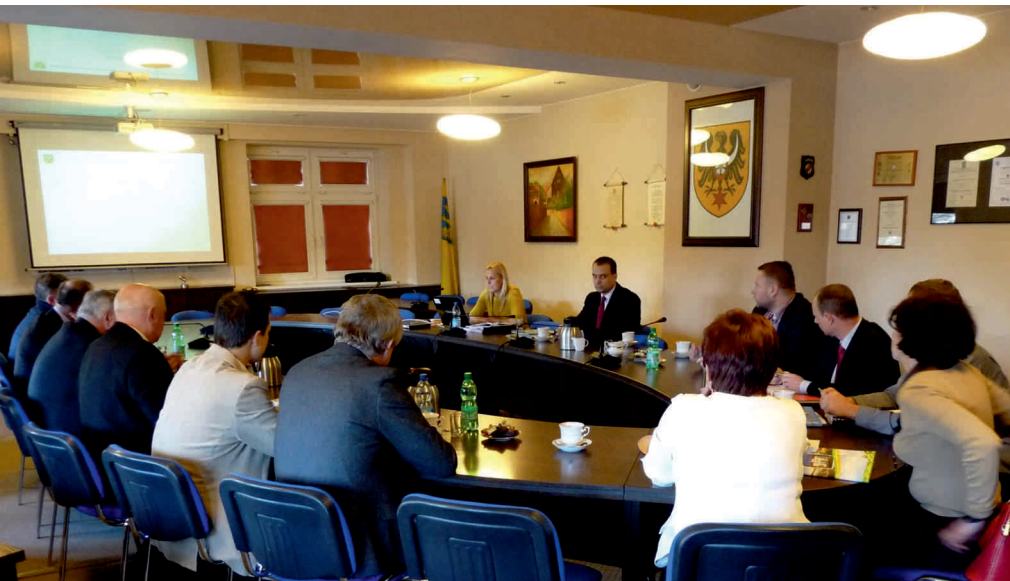
Spotkanie władz Gmin: Namysłów, Wilków, Świerczów, Domaszowice, Pokój i Powiatu Namysłowskiego

Powiat Namysłowski podjął działania koordynujące prace na rzecz pełnego wykorzystania funduszy europejskich.