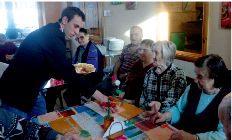
Uczestnik ŚHP częstuje wypiekami podopiecznych „Promyka”

Występ uczestników ŚHP Namysłów w DPS „Promyk” w Kamiennej.