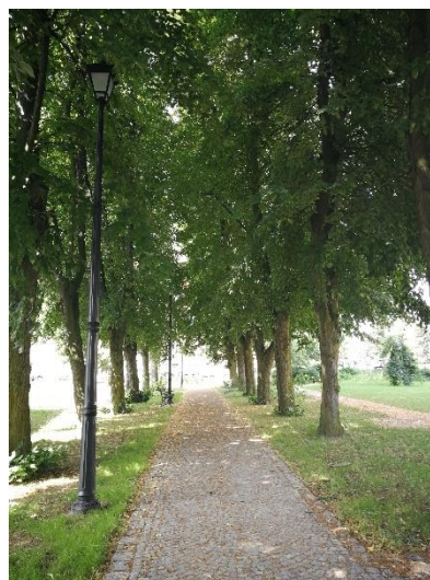
Elementy nowego oświetlenia parkowego

Wdrażane są również działania informacyjno – edukacyjne prowadzone przez Lidera i Partnera projektu.