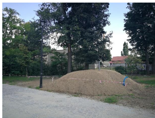
Piwniczka dla nietoperzy – widok z zewnątrz