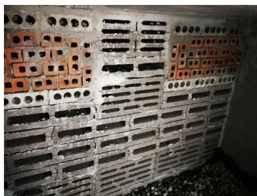
Piwniczka dla nietoperzy – widok z wewnątrz