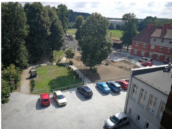
Nowopowstające aleje pieszo – jezdne

Postępują również prace w ramach zadania 2 Odsunięcie presji człowieka od siedliska nietoperzy