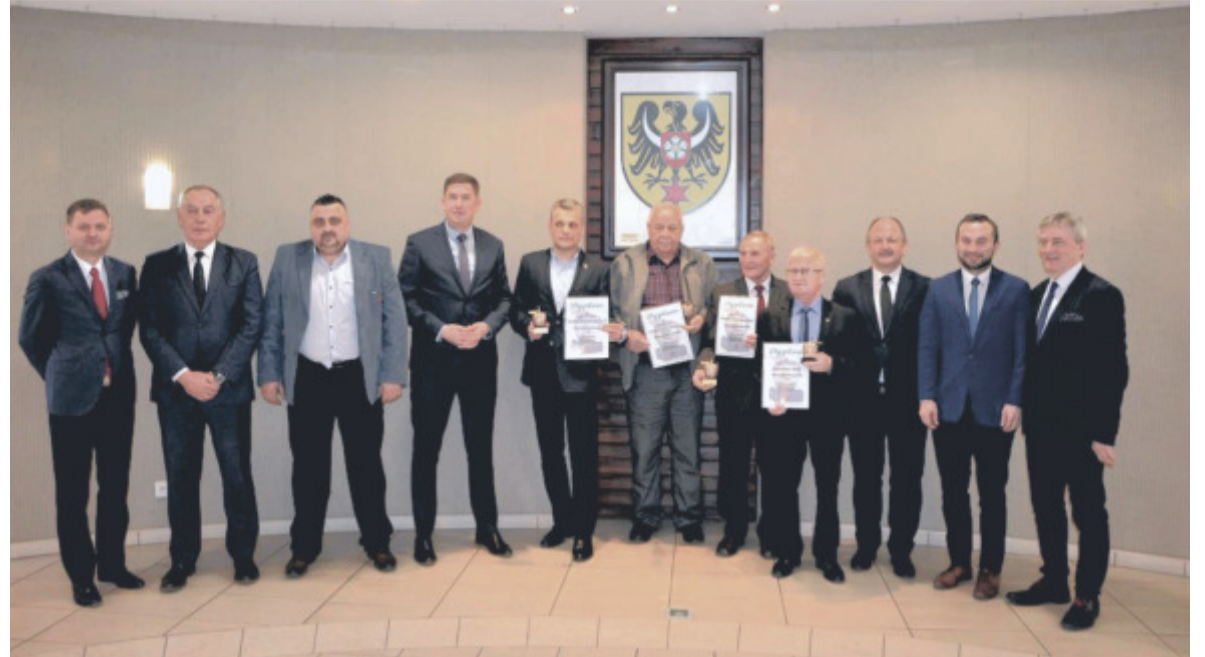
Tegoroczni laureaci plebiscytu wraz z członkami Kapituły Plebiscytowej oraz Zarządem Powiatu

Namysłowski As Ekologii przyznany został za wybudowanie nowoczesnej beztlenowo-tlenowej oczyszczalni ścieków, która zapewni Browarowi Namysłów korzyści w postaci