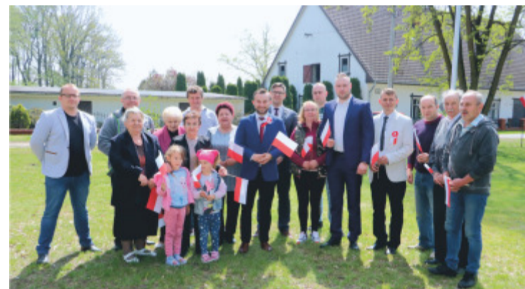
2 Maja - obchody Święta Flagi w Nowym Folwarku