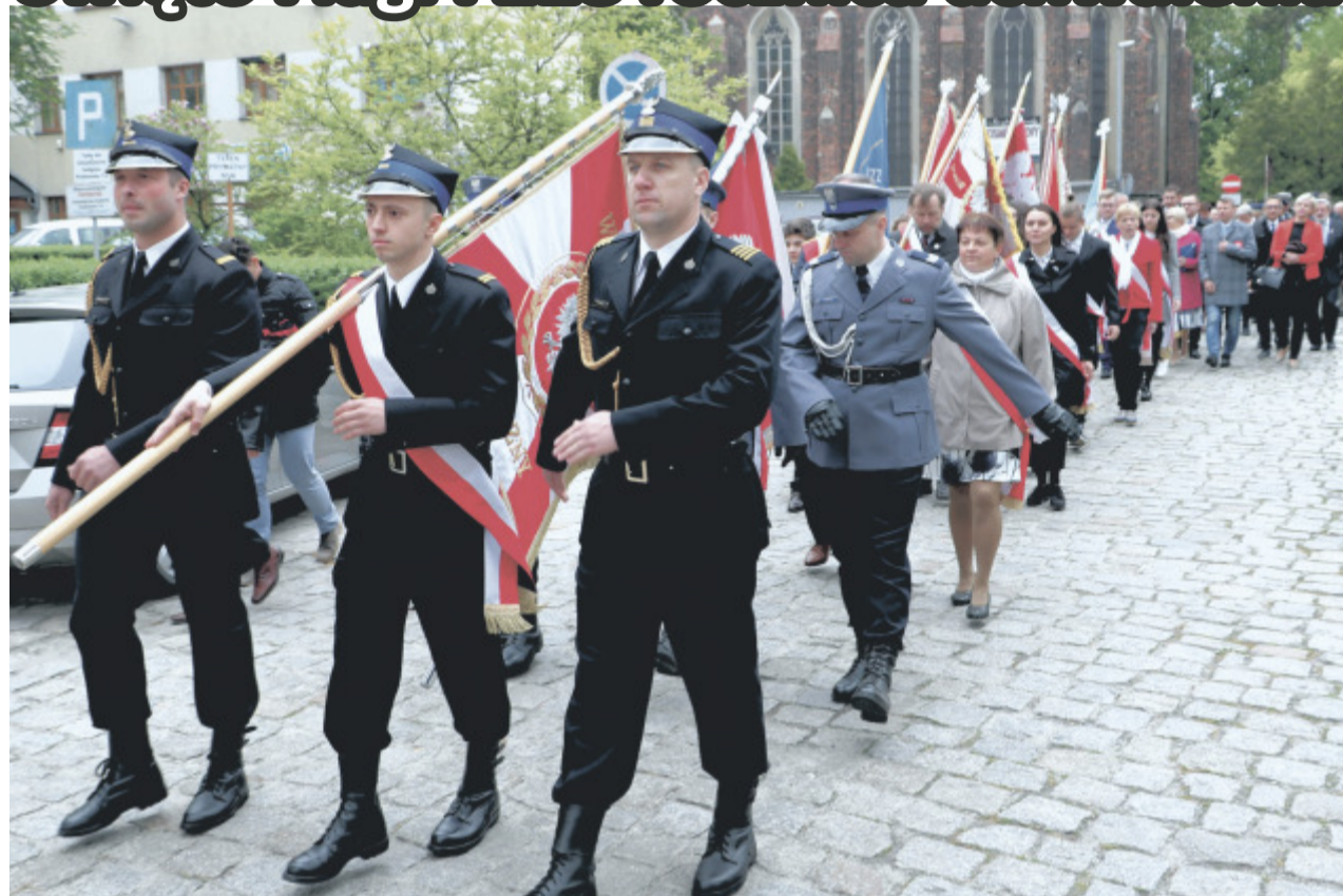
Uroczysty przemarsz pocztów sztandarowych, władz miasta, przedstawicieli władz samorządowych oraz zgromadzonych gości ulicami miasta Namysłów w dniu 3-go Maja 2019 roku