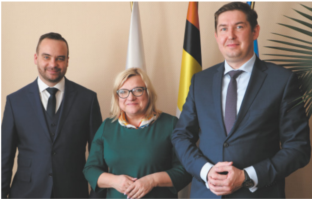
Od lewej stoją: Bartłomiej Stawiarski - Burmistrz Miasta Namysłów, Beata Kempa - Minister ds. pomocy humanitarnej oraz Konrad Gęsiarz - Starosta Powiatu Namysłowskiego

N a początku kwietnia gościliśmy w Namysłowie Panią Minister ds. pomocy humanitarnej Beatę Kempę.