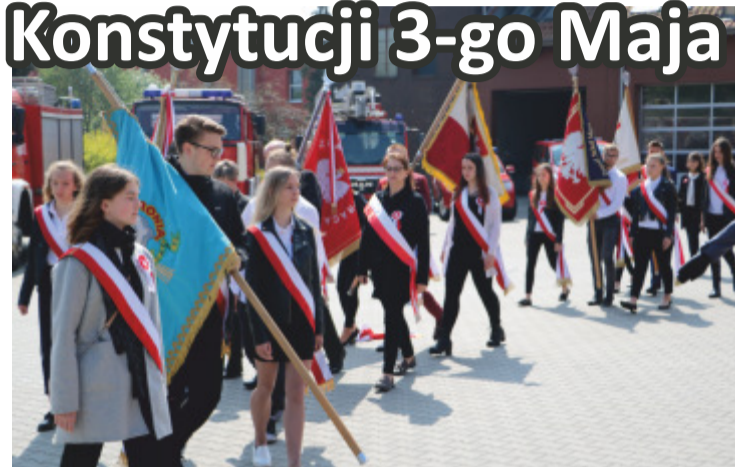
2 Maja - obchody Święta Flagi w remizie Powiatowej Straży Pożarnej w Namysłowie