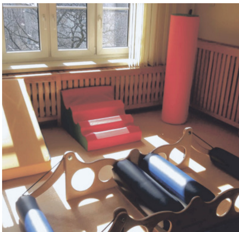
Na zdjęciu jedna z nowo oddanych sal