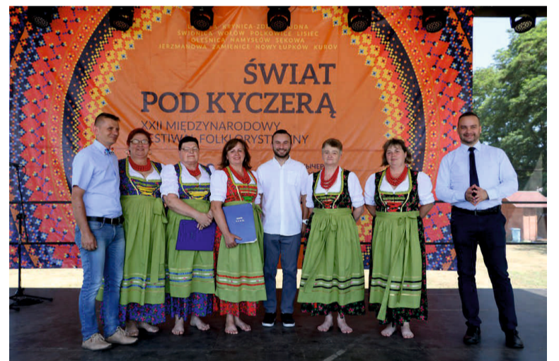
Przedstawiciele władz samorządowych wraz z zespołem ludowym na festiwalowej scenie.