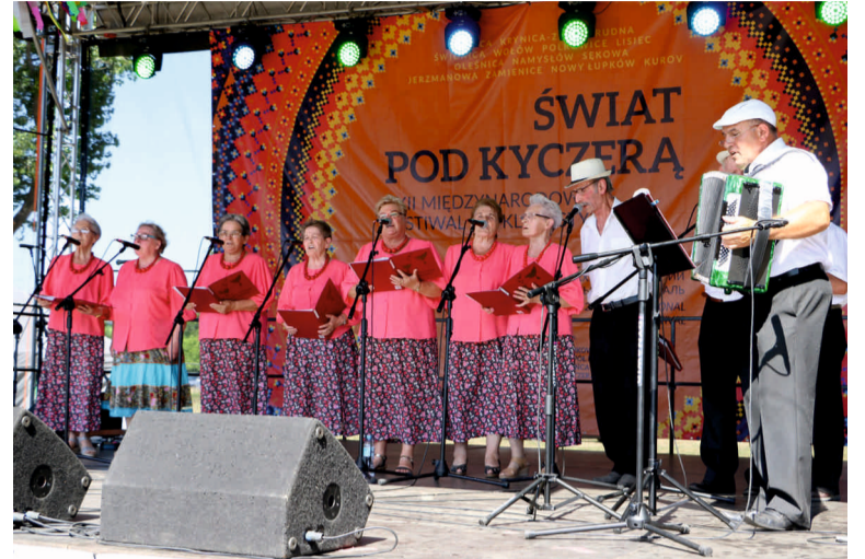
Na scenie festiwalowej występuje zespół ludowy