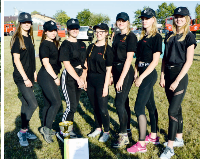
Zwycięska drużyna dziewcząt z Domaradzkiej Kuźni