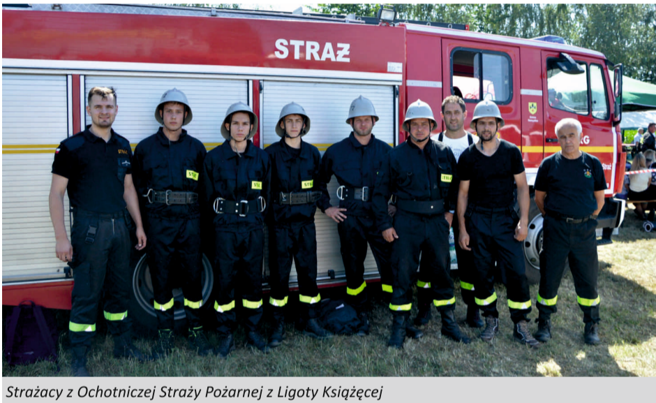
Strażacy z Ochotniczej Straży Pożarnej z Ligoty Książęcej