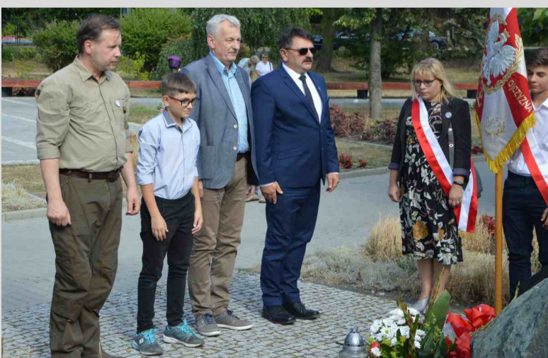
Przedstawiciele Stowarzyszenia Pamięci Armii Krajowej składają kwiaty pod pomnikiem upamiętniającym pomordowanych przez nacjonalistów ukraińskich Polaków na Kresach Wschodnich