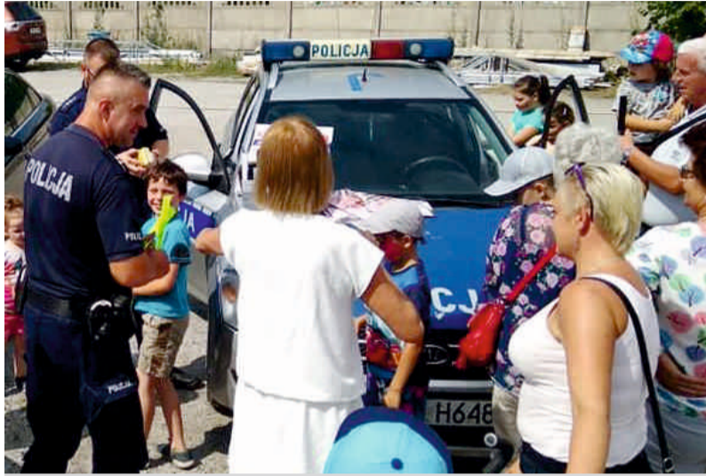
Prezentacja wozu strażackiego podczas festynu w Strzelcach Namysłowskich

W ramach kampanii „Kręci mnie bezpieczeństwo... w wakacje”, namysłowscy dzielnicowi wraz z funkcjonariuszami ruchu drogowego gościli na sobotnim pikniku rodzinnym w Namysłowie oraz w niedzielnym festynie w Strzelcach Namysłowskich. Była to doskonała okazja, aby z całymi rodzinami porozmawiać o bezpiecznym wypoczynku, a najmłodszym przypomnieć podstawowe zasady prawidłowego zachowania nad wodą i na placach zabaw. Wśród wielu atrakcji przygotowanych przez organizatorów,