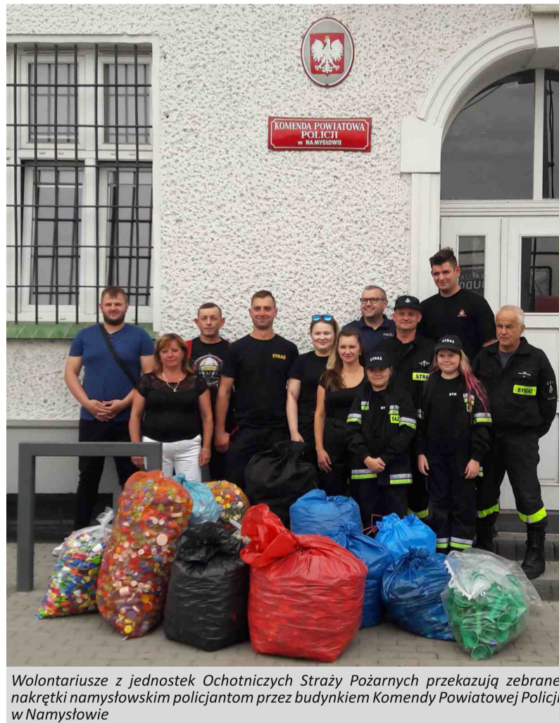
Wolontariusze z jednostek Ochotniczych Straży Pożarnych przekazują zebrane nakrętki namysłowskim policjantom przez budynek Komendy Powiatowej Policji w Namysłowie