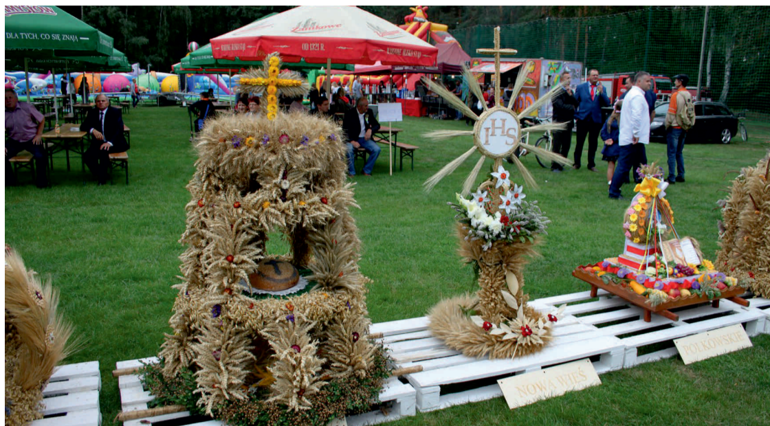
W konkursie udział wzięło 8 sołectw: Domaszowice, Gręboszów, Nowa Wieś, Polkowskie, Siemystów, Strzelce, Włochy, Woskowice Górne oraz Koło Emerytów w Domaszowicach. Komisja konkursowa postanowiła równorzędnie nagrodzić wszystkie 9 dożynkowych wieniec. Wszystkim zwycięzcom serdecznie gratulujemy. Na zdjęciu od lewej widoczne wieniec z Gręboszowa, Nowej Wsi oraz z Polkowskie