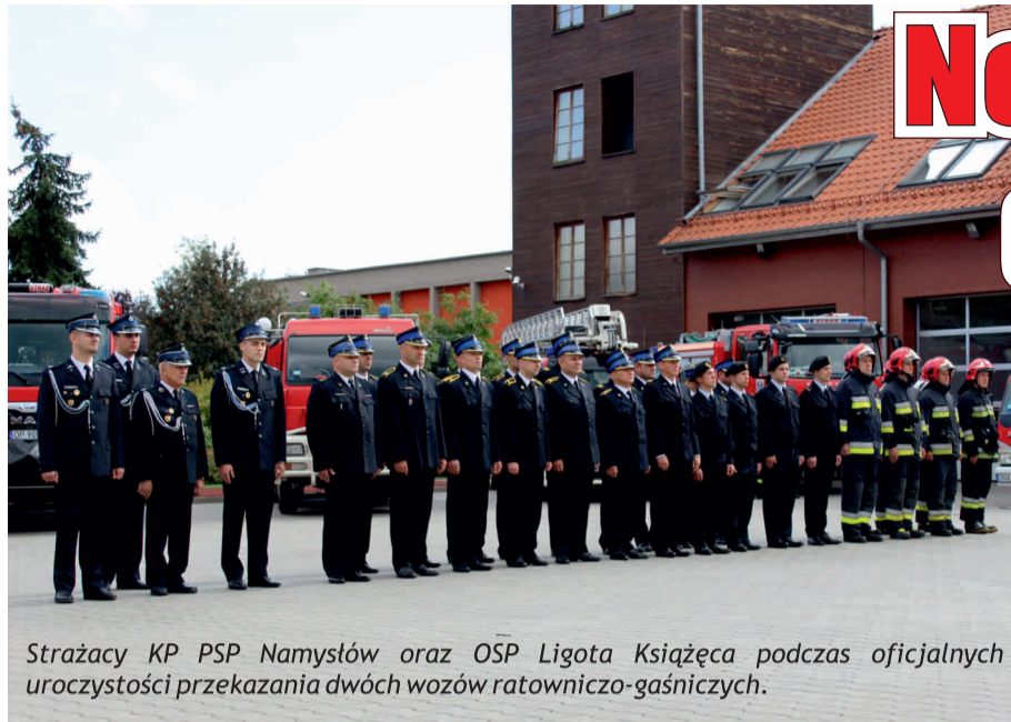
Strażacy KP PSP Namysłów oraz OSP Ligota Książęca podczas oficjalnych uroczystości przekazania dwóch wozów ratowniczo-gaśniczych.

K omenda Powiatowa Państwowej Straży Pożarnej w Namysłowie została wyposażona w dwa nowe samochody ratowniczo-gaśnicze.