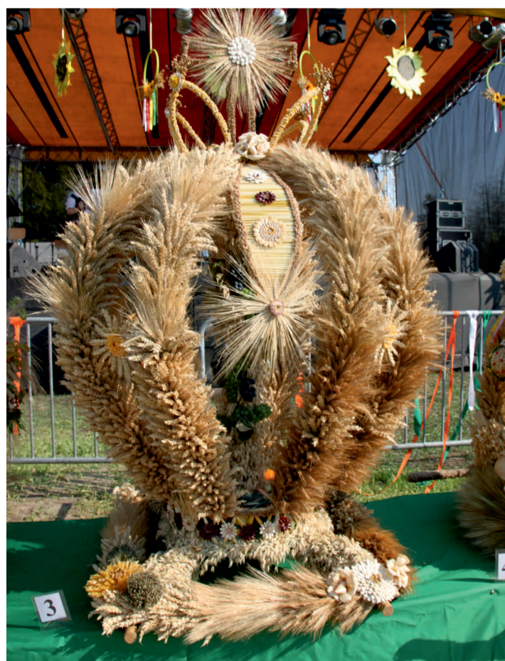
Na Dożynkach Gminnych w Staroścín, które odbyły się 31 sierpnia 2019 r. pierwsze miejsce zdobył wieniec z sołectwa Staroścín