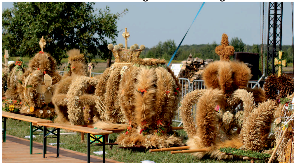
Na dożynkach w Zielencu, podobnie jak w gminie Domaszowice, komisja konkursowa postanowiła równorzędnie nagrodzić wszystkie dożynkowych wieniec. Gratulujemy!