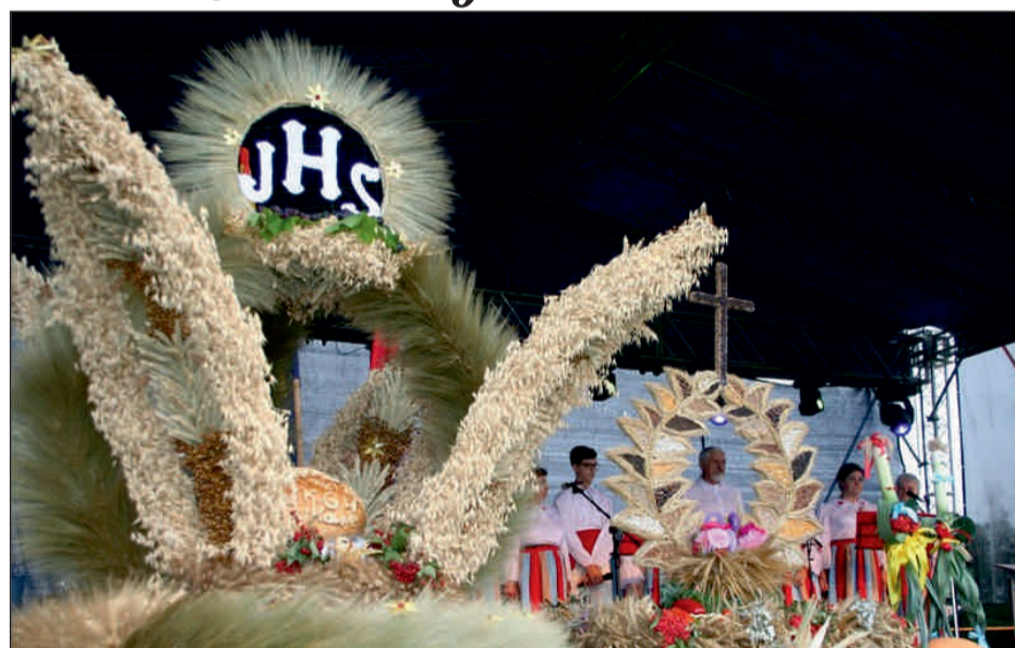
W konkursie na Najpiękniejszy wieniec lub arcydzieło dożynkowe w 2019 r. I miejsce otrzymał wieniec wykonany przez Stowarzyszenie - Koło Gospodyń Wiejskich w Bukowiu