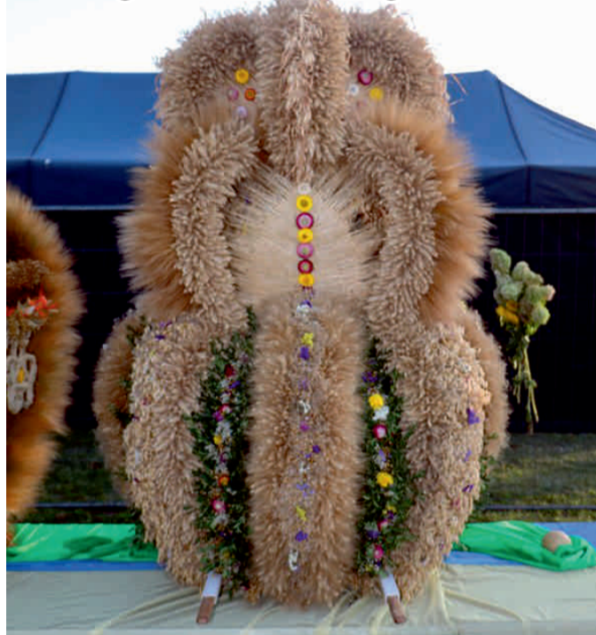
W kategorii konkursu na różnorodne formy twórczości artystycznej związanej z tradycją dożynkową wygrał wieniec sołectwa Nowe Smarchowice - Serdecznie Gratulujemy!