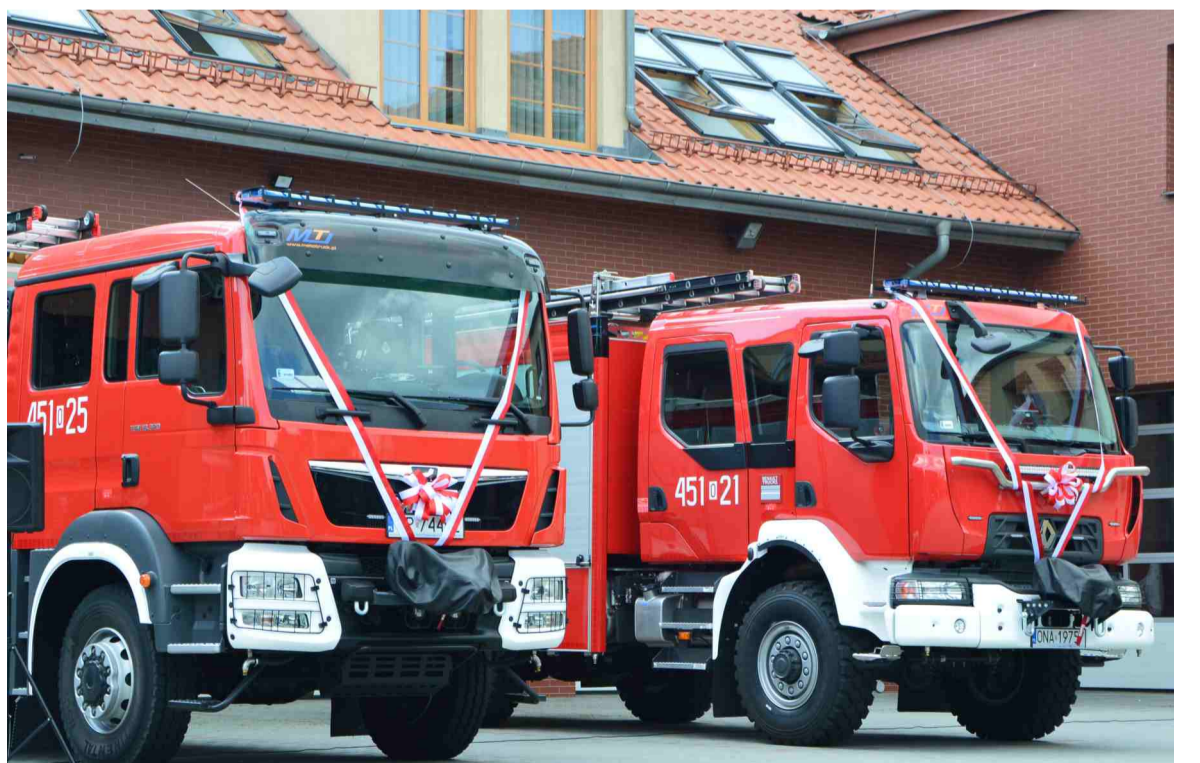
Dwa wozy gaśniczo-ratownicze przekazane KP Państwowej Straży Pożarnej w Namysłowie