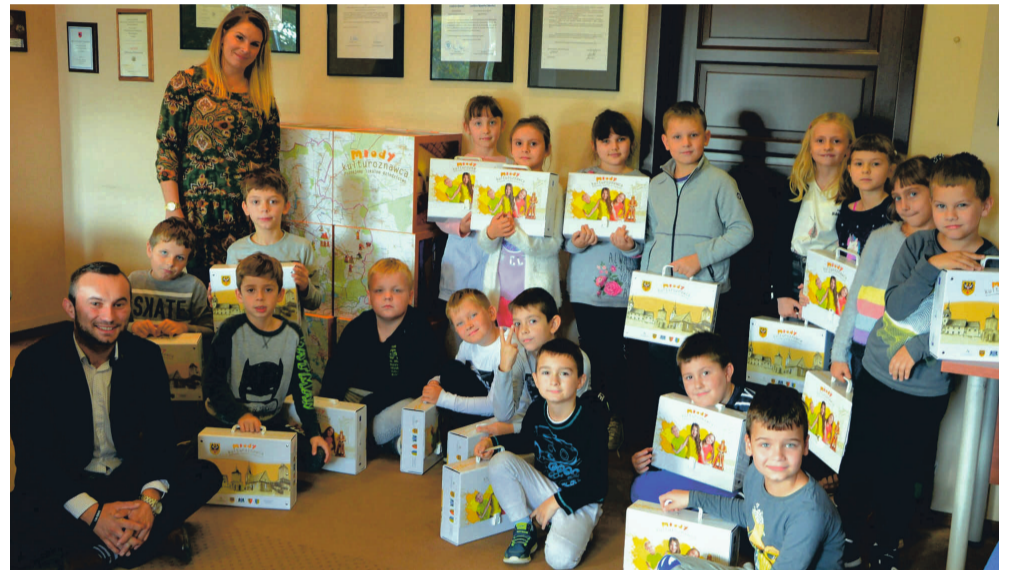
Kuferek edukacyjny „Młody kulturoznawca” wykonany w ramach projektu „Ochrona, promocja i rozwój dziedzictwa kulturowego na obszarze Stobrawskiej Strefy Rehabilitacji i Rekreacji - część północna”, dofinansowanego z Regionalnego Programu Operacyjnego Województwa Opolskiego na lata 2014-2020.