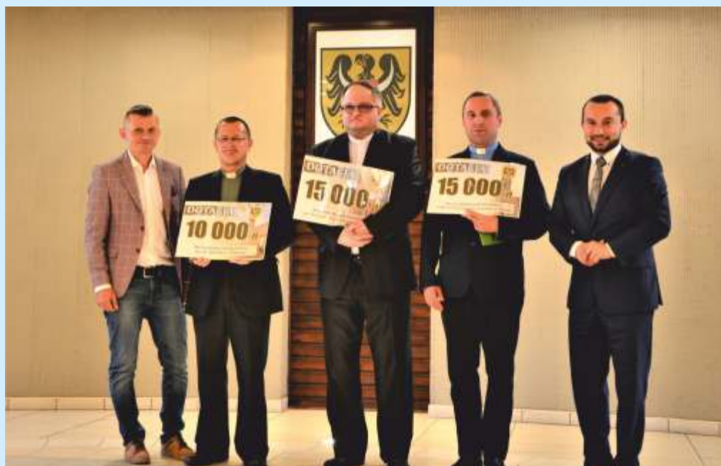
Przedstawiciele Władz Powiatu Namysłowskiego wraz z proboszczami parafii, które otrzymały dofinansowanie