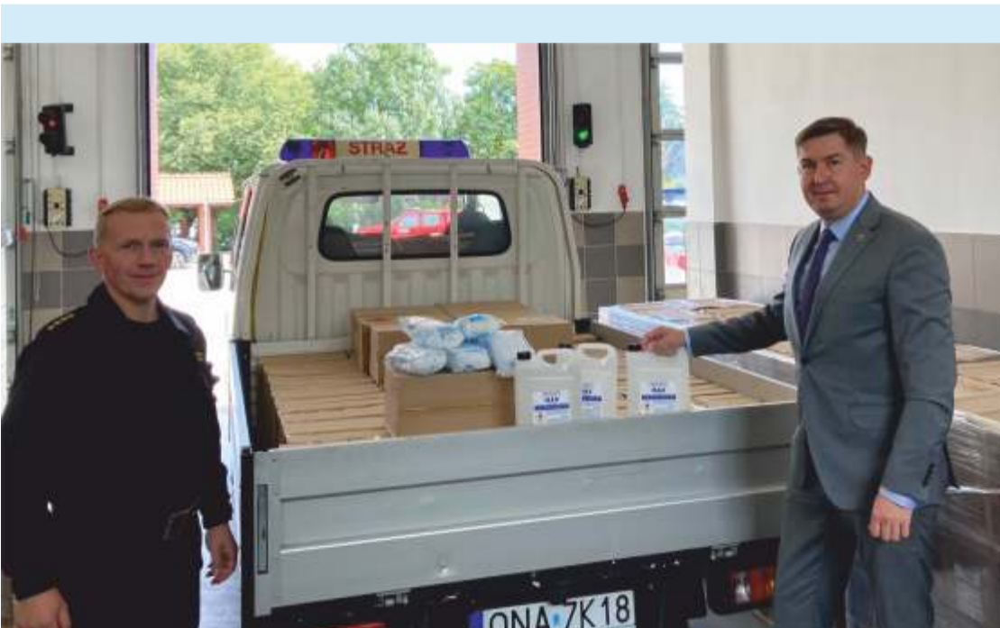
Starosta Powiatu Namysłowskiego oraz Komendant PSP Namysłów podczas rozdysponowania środków dezynfekcyjnych z Ministerstwa Zdrowia w Komendzie Powiatowej Straży Pożarnej w Namysłowie

Dzięki wsparciu z Ministerstwa Zdrowia do wszystkich placówek oświatowych z terenu powiatu namysłowskiego trafiło ponad 4000 litrów płynu dezynfekcyjnego oraz kilkanaście tysięcy maseczek jednorazowych.