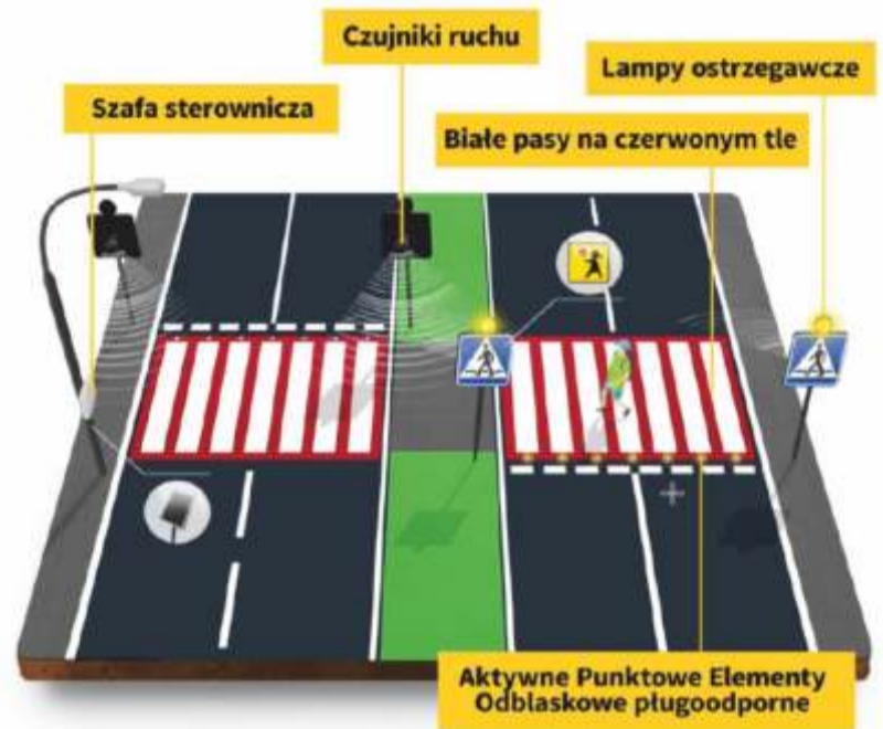
Ilustracja pogłądowa

Projekt „Bezpieczne przejście dla pieszych przy ulicy Łączańskiej w Namysłowie” został dofinansowany z rządowego „Programu ograniczania przestępczości i aspołecznych zachowań Razem bezpieczniej im. Władysław Stasiak na lata 2018 – 2020” VIII-XI 2020