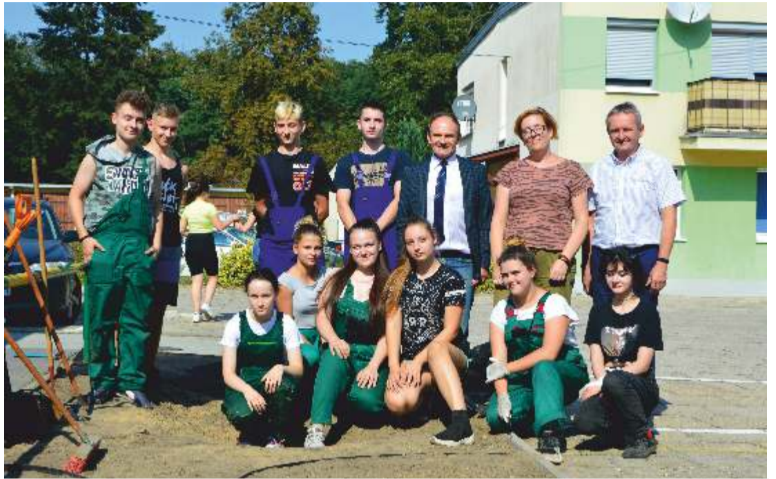
Uczniowie ZSR w Namysłowie wraz z dyrekcją szkoły oraz opiekunem grupy podczas tworzenia instalacji dydaktycznej

Poprzez stworzenie dydaktycznej instalacji o tematyce przyrodniczej i ekologicznej w otoczeniu ZSR pragniemy osiągnąć wzrost poziomu wiedzy, świadomości ekologicznej oraz kształtowania postaw ekologicznych, szczególnie w odniesieniu do racjonalnego gospodarowania wodą w zieleni miejskiej i właściwego doboru roślin w odpowiedzi na zmiany klimatyczne, a także wykształcić pozytywnej więzi ze środowiskiem przyrodniczym oraz poczucia odpowiedzialności za jego stan. Pragniemy zwrócić uwagę na zależności jakie występują pomiędzy rozwojem gospodarczym a ochroną środowiska.