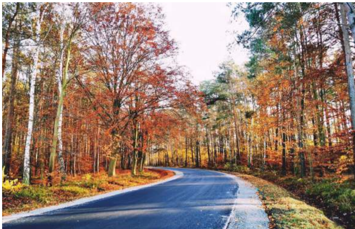
Wyremontowany fragment drogi do Krasowic

Remont drogi zrealizowało Starostwo Powiatowe w Namysłowie wspólnie z gminą Domaszowice , która dofinansowała remont w kwocie 30.000 zł.