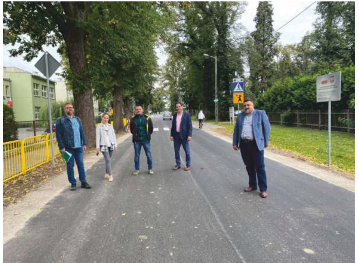
Odbiór wyremontowanego fragmentu drogi na trasie Mikowice-Ligota Książęca. Przejście przy SP w Ligocie Ks.

Mieszkańcy Wielotłęki już od grudnia 2020 roku mogą cieszyć się nową nawierzchnią na drodze powiatowej nr 1111 O na odcinku DK 42 - skrzyżowanie z DP 1197 O. W zakres prac w tym wypadku weszło: wykonanie dokumentacji projektowo-technicznej, wykonanie prac