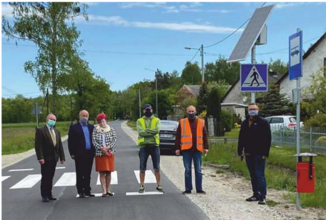
Odbiór drogi powiatowej na odcinku Kozuby-Jagienna