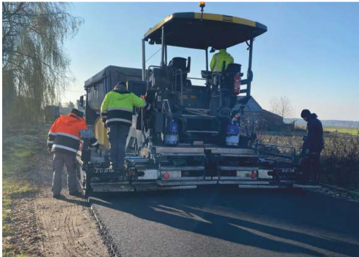
Remont drogi na Wielolekę

Remont na odcinku Starościna-Pieczyska obejmie odcinek drogi o długości ponad 1,5 km. Jest to odcinek prowadzący ruch od miejscowości Starościna, Siemysłów w kierunku miejscowości Pokój przez miejscowość Jagienna. Remontowany odcinek znajduje się w terenie niezabudowanym. W Idzikowicach długość odcinka drogi objętego przedmiotem zamówienia wynosi blisko 1 km. Jest to odcinek prowadzący ruch rowerowy od miejscowości Pągów oraz części miejscowości Idzikowice w kierunku szkoły, przedszkola i kościoła zlokalizowanego w miejscowości Idzikowice.