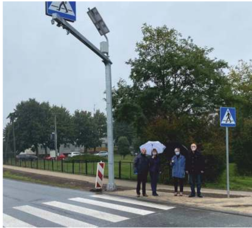
Odbiór przejścia dla pieszych w Domaszowicach

pomiarowych, prace ziemne - korytowanie, regulacja urządzeń obcych typu zasuwy wodociągowe itp., wykonanie nawierzchni jezdni, konserwacja rowów przydrożnych, wykonanie pobocza oraz prace towarzyszące związane z plantowaniem i humusowaniem poboczy i pasa zieleni z obsianiem trawą.