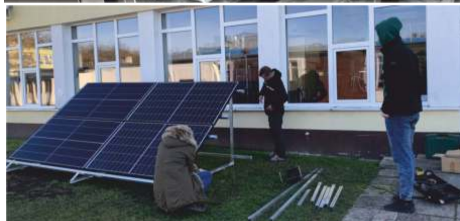
Montaż instalacji fotowoltaicznej w Zespole Szkół Mechanicznych w Namysłowie