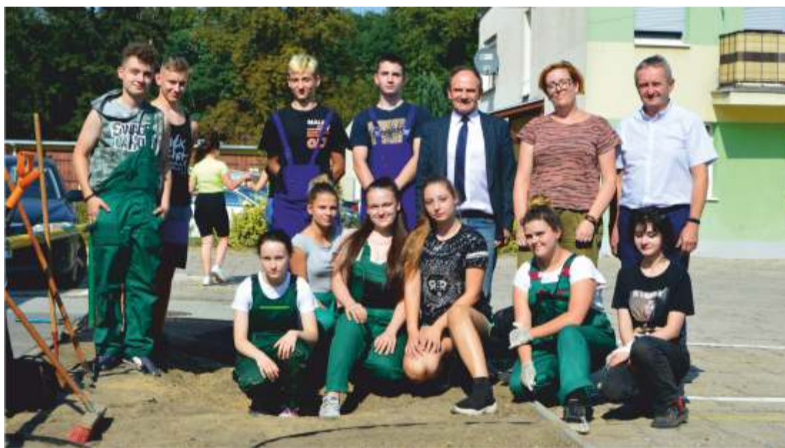
Uczniowie ZSR w Namysłowie wraz z dyrekcją szkoły oraz opiekunem grupy podczas tworzenia instalacji dydaktycznej

Projekt dofinansowany ze środków Wojewódzkiego Funduszu Ochrony Środowiska i Gospodarki Wodnej w Opolu