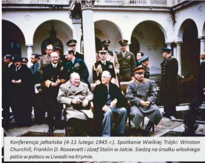
Konferencja jaltańska (4-11 lutego 1945 r.). Spotkanie Wielkiej Trójki: Winston Churchill, Franklin D. Roosevelt i Józef Stalin w Jaltcie. Siedzą na środku włoskiego patio w pałacu w Liwadii na Krymie.

Zanim odniosę się do wyróżnionego zdania dwa uzupełnienia - należy zaznaczyć, że wszelka pomoc Żydom, nawet danie kromki chleba czy szklanki wody było zakazane przez okupantów niemieckich, a łamiącym zakazy groziła śmierć. W nieodległym od Opatowa Chmielniku został zastrzelony