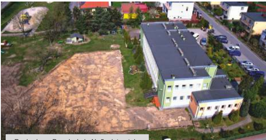
Rozbudowa Przedszkola Nr 5 z lotu ptaka