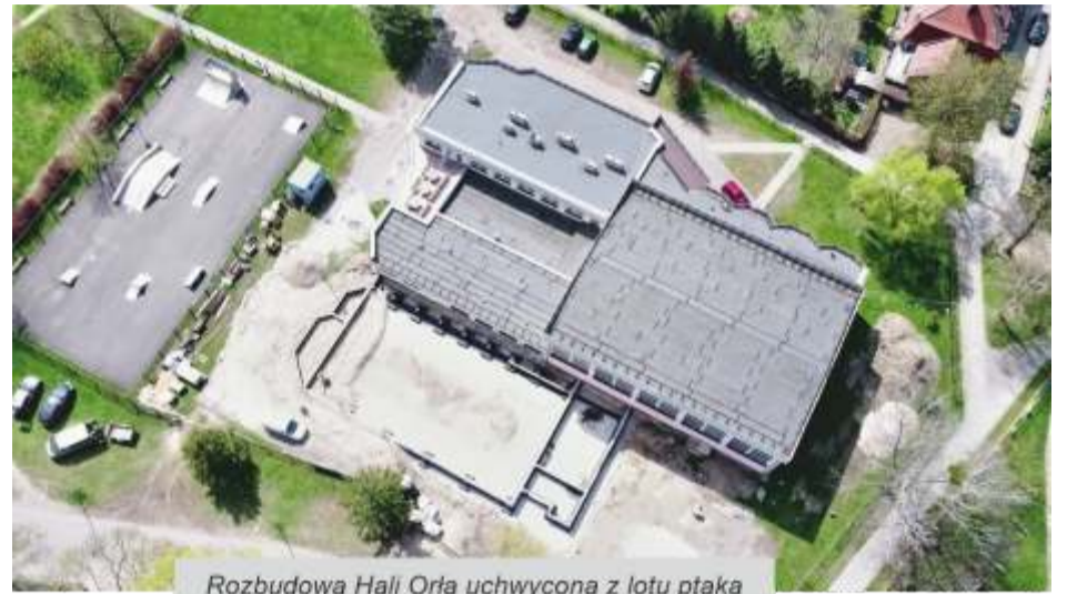
Rozbudowa Hali Orła uchwycona z lotu ptaka

Natomiast w kwietniu br. rozpoczęto drugą dużą inwestycję dot. rozbudowy już istniejącej Hali „Orla” przy ulicy Kolejowej w Namysłowie, w której na co dzień trenują zapasnicy Ludowego Klubu Sportowego „Orzeł” w Namysłowie, siatkarze „Startu” Namysłów oraz uczniowie lokalnych szkół.