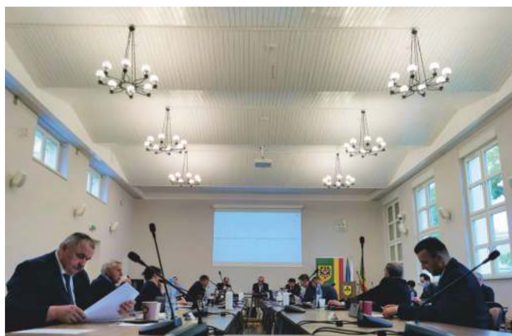
Obrady XXIX Sesji Rady Powiatu Namysłowskiego